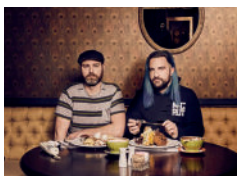
Rouge Pompier au Beat & Betterave