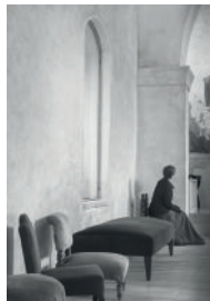
De Bolsena à Rome. Expo de photos de Monique Dupras