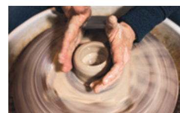
Atelier de céramique chez Amaranthe