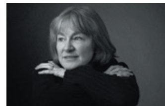
Festival du Film de Knowlton Hommage à Micheline Lanctôt