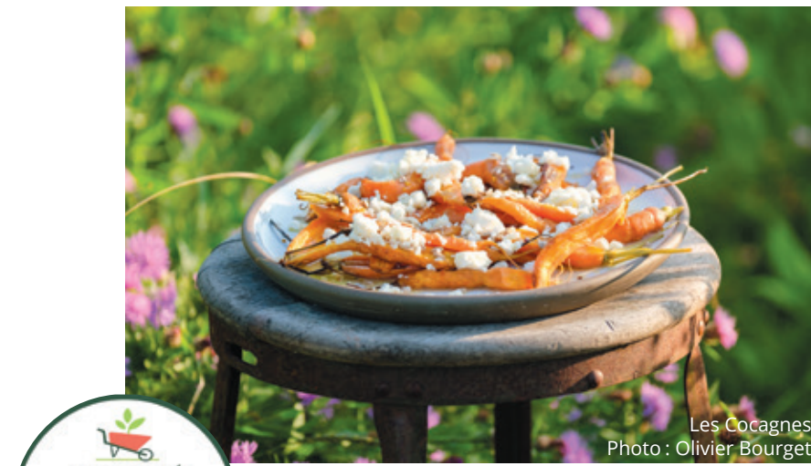
Les Cocagnes