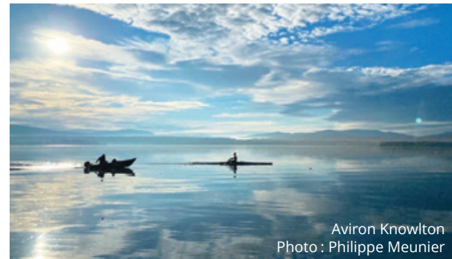
Aviron Knowlton