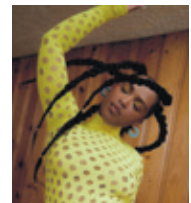
Naomi à Soif de musique