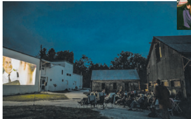
Les Nocturnes à l'École d'Art de Sutton