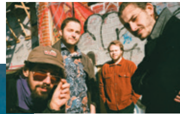
Solarium à Sutton Jazz.