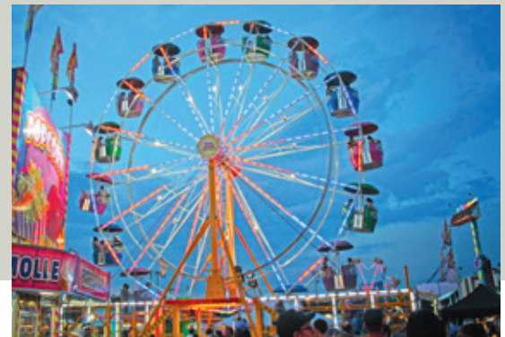
Foire agricole de Brome

Surveillez également les sites de vos salles de spectacle et centres d'art préférés pour les événements de dernière minute, ou consultez www.carrementculture.ca .