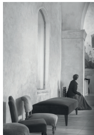
De Bolsena à Rome. Expo de photos de Monique Dupras