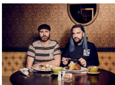
Rouge Pompier au Beat & Betterave