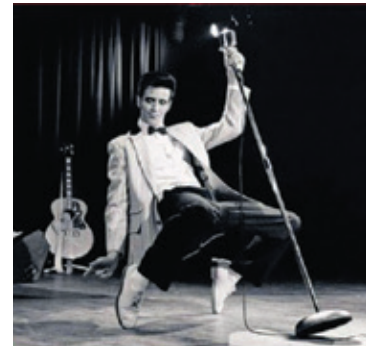
Elvis '56, spectacle-bénéfice pour la Coop Gym Santé Sutton